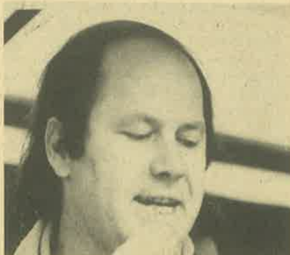
Nur wer bereit ist, Rechte wahrzunehmen, seine Interessen nicht nur

verbal zu vertreten, sondern sich auch demonstrierend oder streikend für sie einzusetzen, wird dafür öffentliches Interesse und öffentlichen Rückhalt finden.