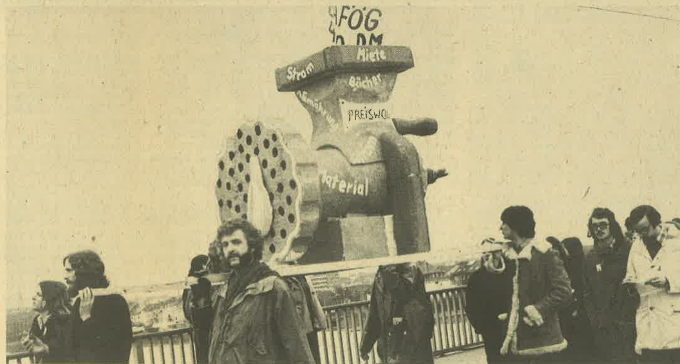
Die Studenten haben sich was einfallen lassen, bei der Vorbereitung. Foto rechts: An seiner Bahre steht: „Er versuchte, vom BAFöG zu leben“.

Der Kampf für einen Inflationszuschlag, für 500 und 1200 DM rückwirkend ab 1. Okt. 73 als erster Schritt zur kostendeckenden Ausbildungsförderung hat bewiesen, daß die Studenten einheitlich handeln können, daß Uni, Ph, GH und Fachhochschulstudenten eine Kampffront bilden können.